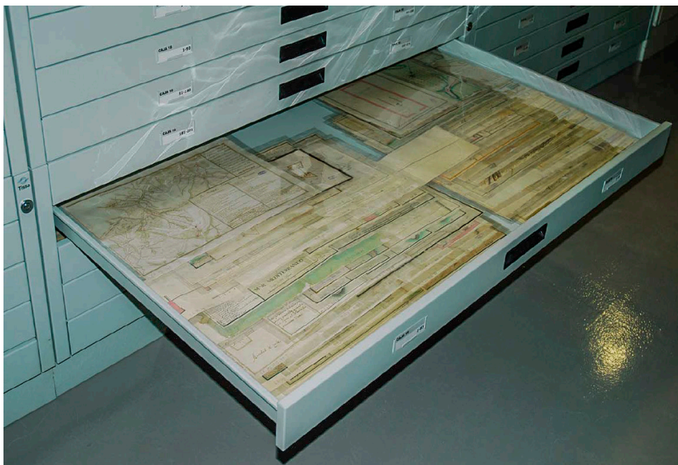
Planeros de la Sección de Mapas. Planos y Dibujos del Archivo General de Simancas (Fot. Archivo General de Simancas).