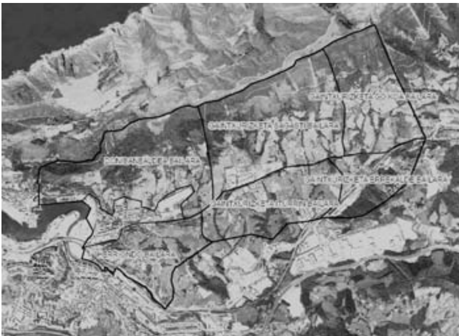
Mapa nº 1.- Lezoko nekazal zonaldeko auzoak

Zahartze prozesu nabaria, "gainzahartzea" ere nabaria delarik. Landa eremuko biztanleen %28a 65 urtetik gorakoa da. Lezo herri osoaren biztanleriaren %13 a da 65 urtetik gorakoa. Landa eremuan 65 urtetik gorakoen portzentaia altuagoa da Lezo osoan baino. Lezoar biztanleria osoan 91 urtetik aurreko 14 pertsona daude horietatik 5 landa ere muan bizi dira. Landa eremuan 76 urtetik gorako 50 perts ona daude; landatarren %11,5a. Adin tartea 76 urtetik 99 urteraino zabaltzen da. 76 urtetik aurrera gaixotasun, ezintasun eta laguntza beharra areagotzen da. Ildo honetan osasun zerbitzuko profesionalak gaixo kronikoak eta baserrietara bisitak areagotu direla adierazten dute. Elkarrizketatutako Adinekoen %72ak du gaixotasunen bat. Elkarrizketatuen artean laguntza behar izaten dutela esan dutenen kopurua 30 pertsonakoa da. Jantzeko, otorduak prestatzeko, medikuetara joateko, dutxatzeko, enkarguak egiteko eta hauek etxera ekartzeko, pastilak har ditzaten edota etxeko lanetarako behar izaten dute laguntza.