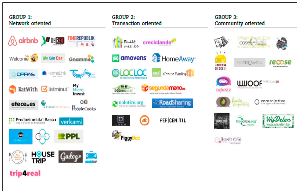
Figura 5. Tipología de plataformas de consumo colaborativo