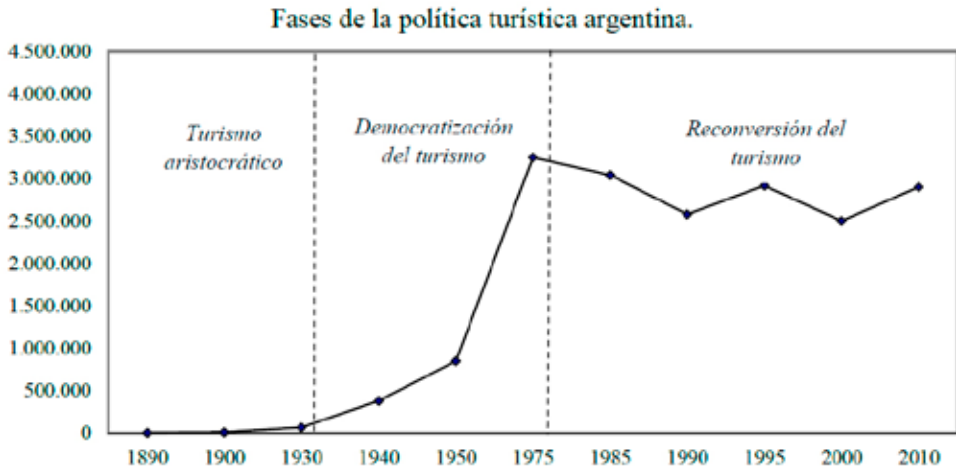
Figura 2. Evolución de los turistas alojados en establecimientos turísticos de Mar del Plata 4 . Fases de la política turística argentina.